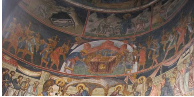
Fig. 5. Biserica Domnească Sf. Nicolae din Curtea de Argeș, altar. Cortul Mărturiei.