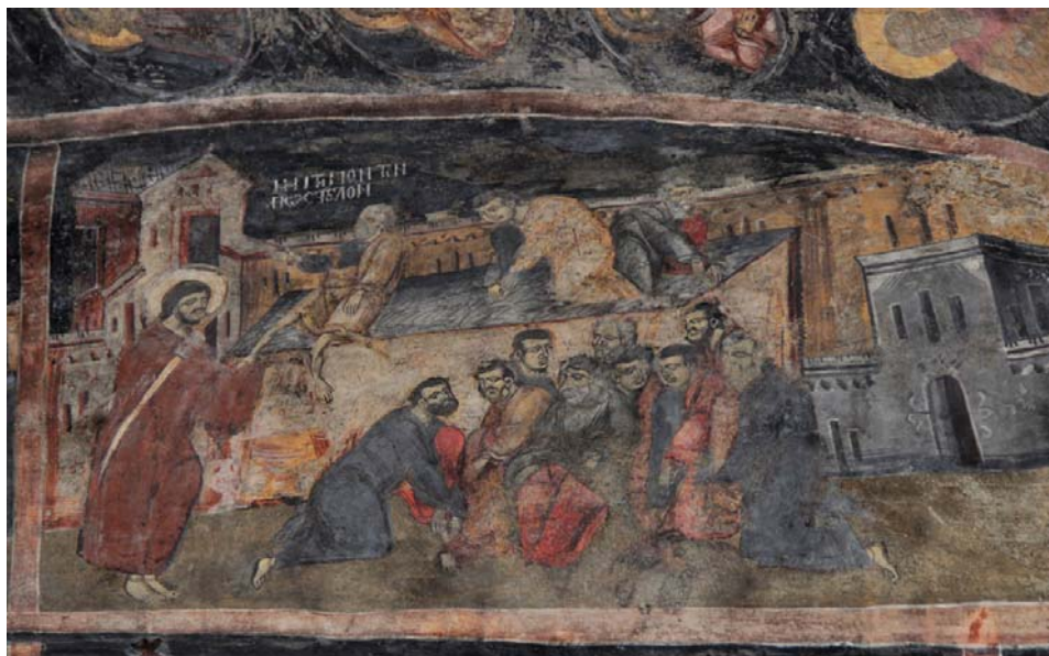
Fig. 17. Biserica Înălțarea Domnului din Băbeni, Buzău, naos. Spălarea picioarelor.