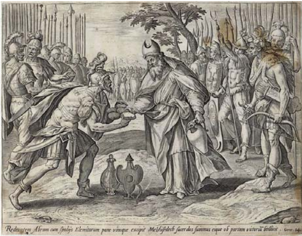
Fig. 12. Biblia Piscator (1602-1604). Întâlnirea lui Avraam cu Melchisedec.