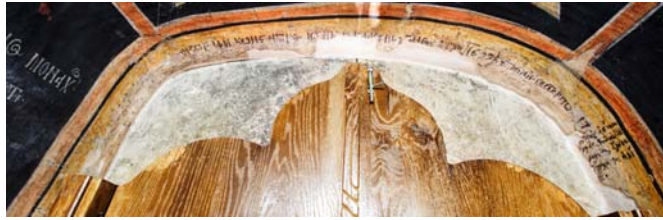
Fig. 1. Biserica Adormirea Maicii Domnului din Râmnicu Sărat, glaful ușii de intrare. Inscripția zugravilor.