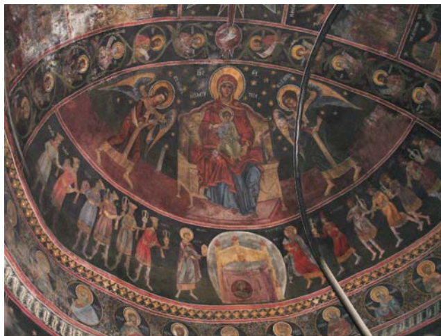
Fig. 4. Biserica Adormirea Maicii Domnului din Râmnicu Sărat, altar. Cortul Mărturieii.