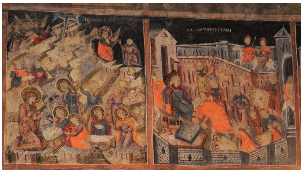
Fig. 18. Biserica Înălțarea Domnului din Băbeni, Buzău, naos. Nașterea Domnului, Uciderea pruncilor.