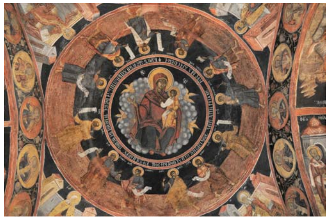
Fig. 15. Biserica Înălțarea Domnului din Băbeni, Buzău, calota pronaosului.