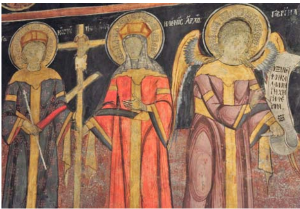
Fig. 14. Biserica Înălțarea Domnului din Băbeni, Buzău, naos. Sfinții Împărați Constantin și Elena, sf. Arhanghel Gavriil.