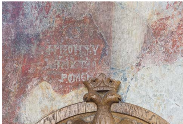
Fig. 3. Biserica Adormirea Maicii Domnului din Râmnicu Sărat, naos, scena Arhanghelului Mihail (detaliu, inscripție).