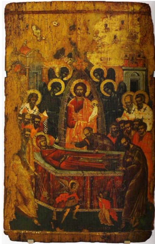
Fig. 6. MNAR, Adormirea Maicii Domnului (provenită de la Biserica Adormirea Maicii Domnului din Râmnicu Sărat).