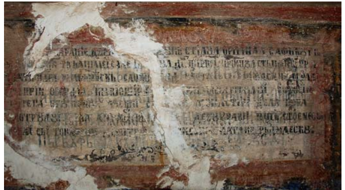
Fig. 13. Biserica Mănăstirii Gura Motrului, pridvor. Pisanie.