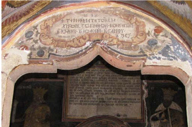
Fig. 2. Biserica Domnească din Târgoviște, ușa din naos. Inscripția zugravilor.