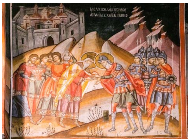
Fig. 10. Biserica Mănăstirii Gura Motrului, altar. Întâlnirea lui Avraam cu Melchisedec.