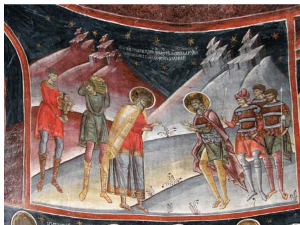
Fig. 11. Biserica Biserica Mănăstirii Surpatele, altar. Întâlnirea lui Avraam cu Melchisedec.