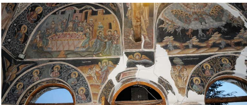
Fig. 19. Biserica Înălțarea Domnului din Băbeni, Buzău, pridvor. Nunta din Cana, Căderea îngerilor și inscripția zugravilor.