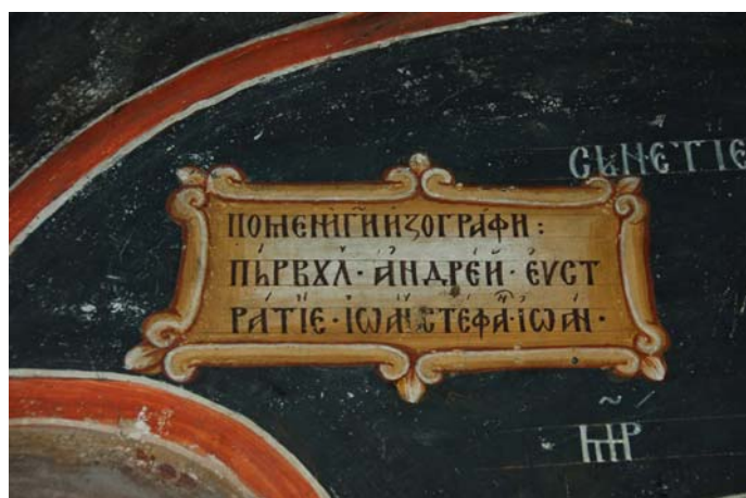
Fig. 9. Biserica Mănăstirii Gura Motrului, altar. Inscripția zugravilor.