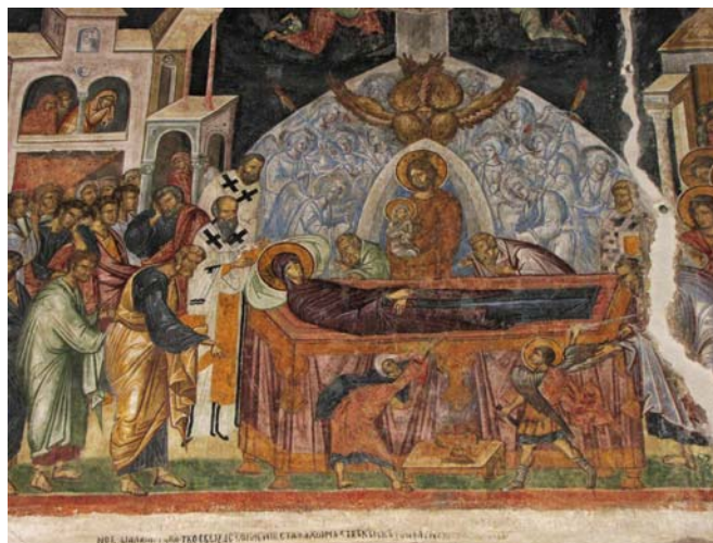
Fig. 7. Biserica Domnească Sf. Nicolae din Curtea de Argeș, naos. Adormirea Maicii Domnului.