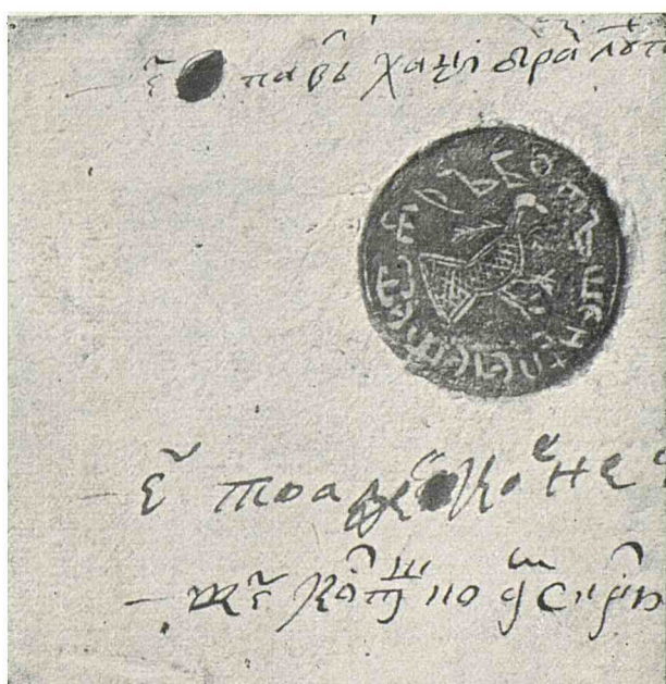
Trei peceti nouă, din secolul al XVIII-lea, ale orașului Botoșani.